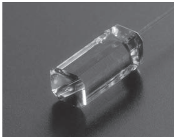
ポリゴンキャピラリー使用